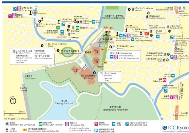
国際会館周辺マップ ICC Kyoto Area Map